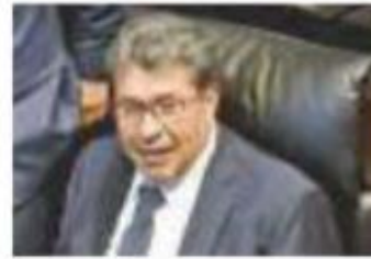
Ricardo Monreal en el Senado, ayer.

CON 97 VOTOS A FAVOR, 22 en contra y una abstención, el Senado, con mayoría de Morena, aprobó ayer, la nueva Reforma Educativa; deja puerta abierta a la CNTE para la adjudicación de las plazas en el magisterio. Pág. 6