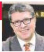
Ricardo Monreal Coordinador de Morena en el Senado

La reforma viene a cubrir un vacío en la relación magisterio-gobierno-instituciones”