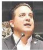
Damián Zepeda Senador del PAN

La reforma viene a cubrir un vacío en la relación magisterio-gobierno-instituciones”