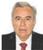
Rubén Rocha Senador de Morena

El mundo cambió y México es un gigante que no puede estar detenido en la sociedad del siglo XXI”