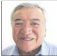
Por Miguel Ángel Rivera

“En la 4T (Cuarta Transformación), los senadores de Morena estamos con los maestros de México/Compromiso cumplido”.