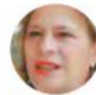
Josefa González B.

La titular de Semarnat, Josefa González Blanco , demostró que en la defensa de la vaquita marina está dispuesta a agarrar al toro por los cuernos . Ayer se reunió con los habitantes de San Felipe, Baja California, para diseñar métodos de producción pesquera sustentable. Hablamos justamente de la zona en la que operan las bandas que trafican con la totoaba.