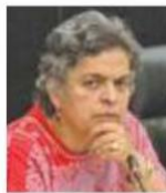
Beatriz Paredes Senadora del PRI

Es impensable que la reforma esté enfocada a quitar elementos para elevar calidad de la educación”