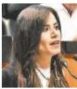
Verónica Weigand Senadora de Movimiento Ciudadano

El propósito de la Reforma ha sido responderles a los maestros, darles confianza, revalorar su función”