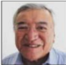
Por Miguel Ángel Rivera

Aunque en apariencia ganaron mejores condiciones de trabajo con la "nueva reforma educativa", esos beneficios no se reflejaron en los salarios de los trabajadores de la Educación, quienes recibieron aumentos casi idénticos a los del año anterior, el último del repudiado régimen encabezado por el ex presidente Enrique Peña Nieto.