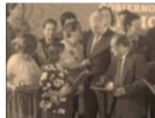
El presidente entregó reconocimientos a maestros.

“En este momento tenemos alrededor de 20 millones de libros ya concluidos, se requieren 176 millones para entregar el primer día del calendario escolar (...) a fines de este mes tendremos alrededor de otros 80 millones de libros, 15 días después otros 55 y después llegaremos a la meta total. Y se requieren alrededor de tres semanas para su distribución”, comentó.