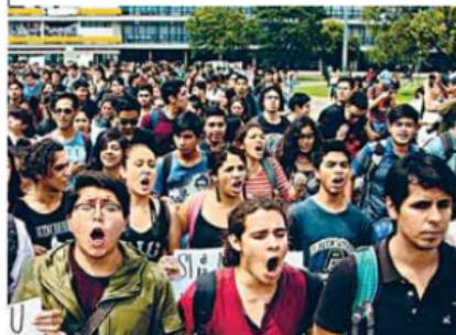
- Necesario. Para lograr la gratuidad primero debe definirse cuánto costaría realmente.

"El camino a la gratuidad debe comenzar por el establecimiento de reglas claras en la asignación de sus recursos, acompañadas de fórmulas, con base en indicadores de desempeño, transparencia y eficacia en el uso de los recursos. También se debe fomentar la mayor recaudación de recursos propios, así como las aportaciones de los estados y municipios hasta alcanzar el objetivo de 50-50", propone la Coparmex.