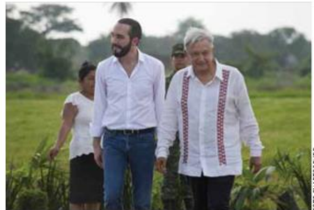
Los mandatarios sembraron un árbol en un acto de unidad entre naciones.

Por su parte, López Obrador aseguró que esta iniciativa es una consecuencia de las políticas emprendidas con Estados Unidos y los compromisos bilaterales para el mejoramiento del flujo migratorio desde