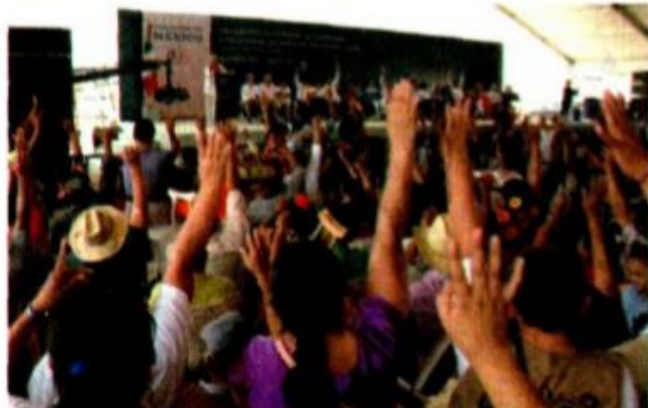
Las consultas a mano alzada son algunas prácticas que han causado controversia en lo que va del gobierno de López Obrador.