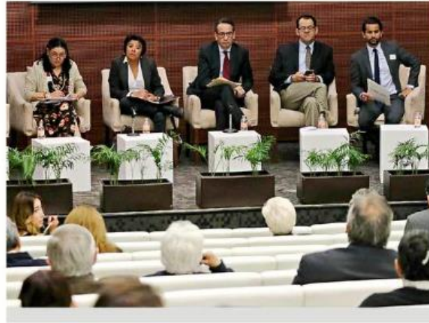
El Senado convocó a un foro sobre las leyes secundarias de la reforma educativa.

Indicó que un tema que preocupa a maestros es el