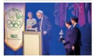
La justa internacional tendrá lugar en Hungría.

- Apoyo. Los estudiantes recibirán capacitación y entrenamiento especializado en la UNAM, bajo el auspicio de la Academia Mexicana de Ciencias.