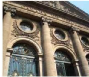
El 8 de septiembre, a más tardar, deberá presentarse el proyecto.

Esa expresión significa que difícilmente se tendrían crecimientos significativos en el subsidio federal. De