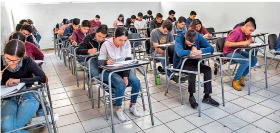
-Oportunidades. La internacionalización de los universitarios mediante becas y movilidad ya no es un lujo, sino una necesidad.