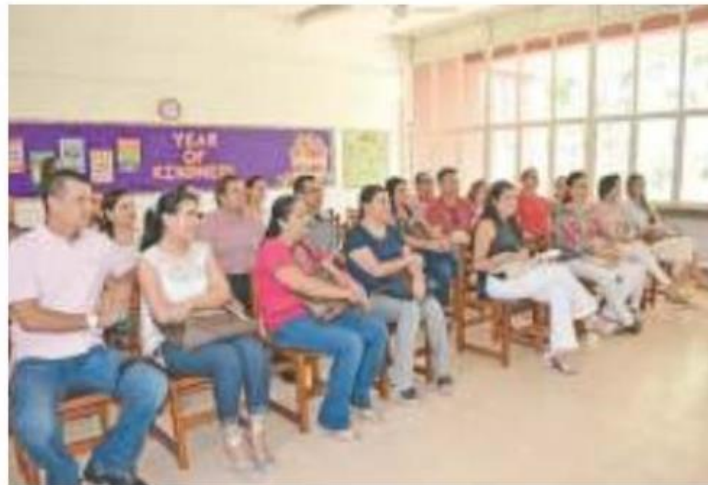
Padres de familia en junta. Especial

GOBIERNO AFIRMA que la medida tomada es para prevenir el desvío de recursos, “nadie lo gastará con mayor sensatez que ellos”, indican; el presupuesto es para reparar los planteles educativos