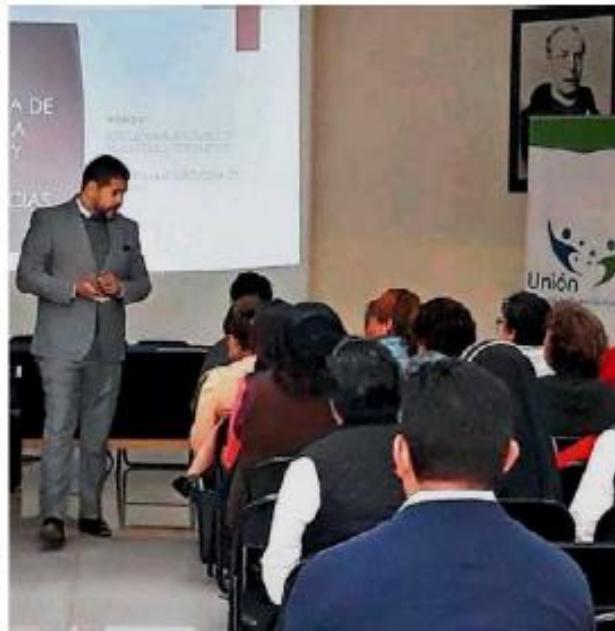
La UNPF agregó que los maestros con verdadera vocación imparten clases todos los días.

LA UNPF coincide en que la Ley de Educación debe garantizar protección y desarrollo a maestros