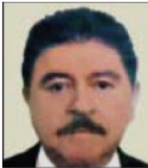
Por Armando Sepúlveda Ibarra*

En los tiempos que corren la clase política en el poder ya siente en sus aterradas nuca el aliento opresor del más fuerte aspirante a la Presidencia de la República y, como una señal clara, el miedo a la derrota ante el enemigo real en 2018 desató ya la guerra sucia contra la pujante y ascendente figura de Andrés Manuel López Obrador entre los electores, para alimentar la angustiosa ilusión de minarle el camino rumbo a Los Pinos con burdos e inofensivos ataques en todos los frentes del oficialismo, de los comparsas disfrazados de oposición y de su servidumbre de pluma y papel, micrófono y lavaderos de café, toda una variedad de faunas siempre atentas y obedientes a la vil consigna de la corte de los milagros en turno.