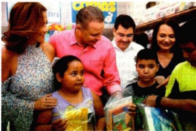
El mandatario estatal, Quirino Ordaz Coppel (rosa), entregó los primeros uniformes y los útiles escolares en diversos establecimientos y papelerías.

● Gobierno invierte 280 mdp en paquetes escolares y uniformes para educación básica