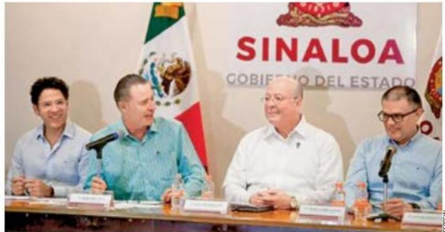
CONVENIO. El gobernador Quirino Ordaz agradeció a los rectores y directivos de diversas escuelas, la respuesta para ampliar la matrícula de los jóvenes de la entidad.

Esto, puntualizó, les provoca una gran frustración tanto a ellos mismos como a sus familias, al ver que no hay espacios en los niveles medio superior y superior, pues es algo que impacta mucho y a la propia sociedad le