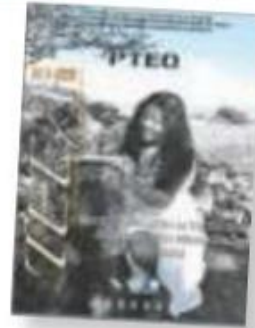
Portada del programa educativo distribuido por la CNTE a sus afiliados en Oaxaca.

de Estudios Avanzados del IPN porque "es largo, desordenado y repetitivo". Dirigentes de la Coordinadora en esa entidad indicaron que utilizarán el programa y los libros de texto gratuitos de la SEP sólo como material de apoyo y complementario al Plan para la Transformación de la Educación, que critica el neoliberalismo y el crecimiento económico. Pág. 4