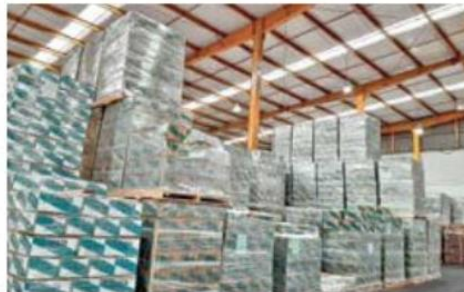
OPORTUNIDAD. Miles de estudiantes discapacitados visuales se verán beneficiados con los textos gratuitos.

“En estos talleres hacemos los libros de primaria y secundaria para