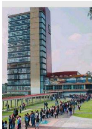
Cientos de rechazados se manifestaron en CU

PODRÁN SELECCIONAR entre 141 licenciaturas, 66 ingenierías y 67 programas de Técnico Superior