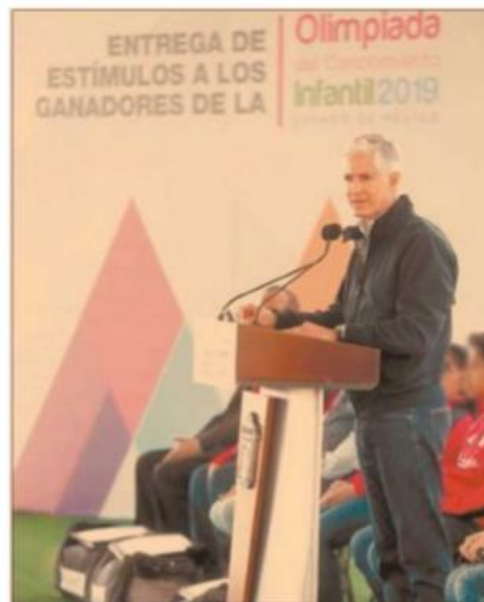
En Tenango del Valle, el gobernador del Estado de México entregó estímulos a 74 estudiantes de primaria ganadores de la Olimpiada del Conocimiento Infantil 2019.

Alfredo del Mazo anunció que, de cara al inicio del ciclo escolar, todos los estudiantes de preescolar, primaria y secundaria del Estado de México recibirán sus útiles escolares de forma gratuita, en apoyo a la economía familiar y para