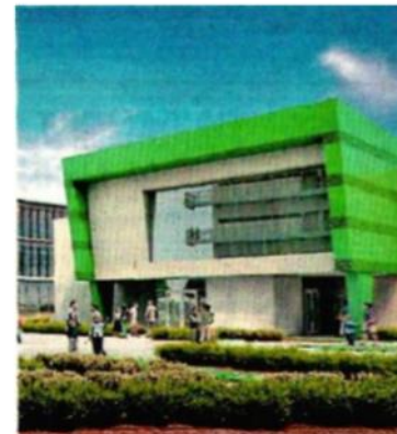
- Espacio. La reunión tuvo lugar en la FEyRI.

- Clubes. Los temas de las actividades fueron desde la relación del Océano y el espacio hasta la inteligencia artificial.