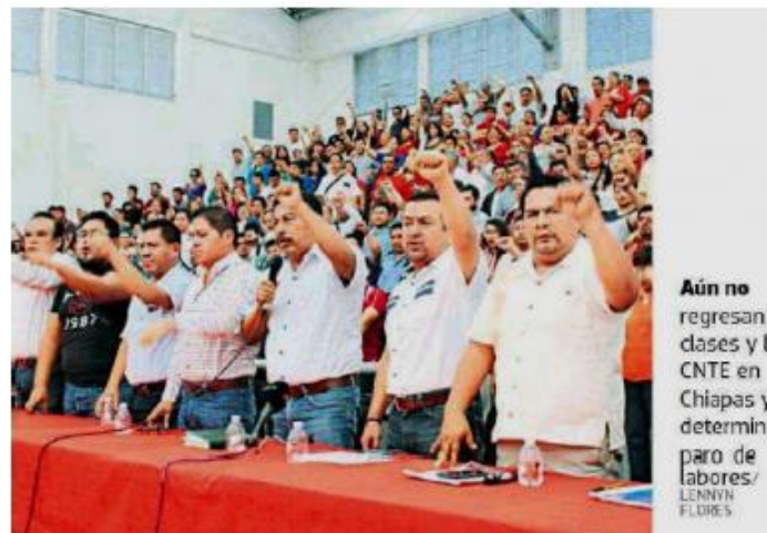
Aún no regresan a clases y la CNTE en Chiapas ya determinó paro de labores. LENNY FLORES

La CNTE en Chiapas advirtió de paro laboral por la desatención a sus demandas y reclamos, aunque aún no tienen fecha definida