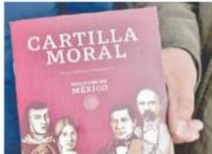
La Cartilla Moral será utilizada por la SEP para enseñar ética y civismo. Especial

“Para hacer un cambio, se necesita mucho más que la entrega de este tipo de obras. Nosotros estamos conscientes sobre la necesidad de un cambio de fondo pero para ello se necesita también acabar con la impunidad, y quitar de los medios aquellos programas, series o canciones que sólo hacen apología del delito y que dejan en nuestros estudiantes que el mejor camino para ser rico, es haciéndote sicario, repartidor