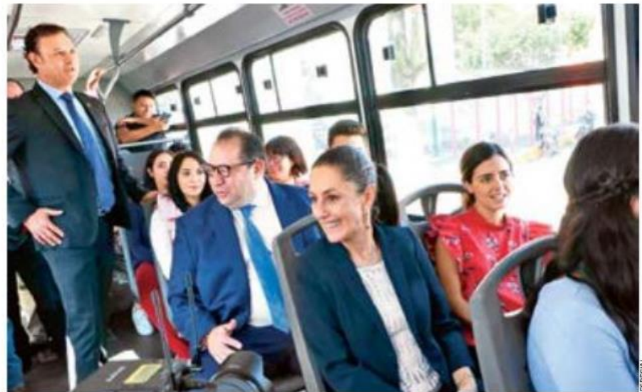
ruta estudiantil. La jefa de Gobierno inauguró el Transporte Seguro desde Huipulco hasta la Universidad del Pedregal, que incluye paradas en el Colegio de México y el Tecnológico de Monterrey.