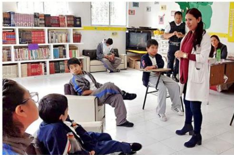
Los talleres abordan temas de salud, inseguridad, vulnerabilidad y emociones para crear impacto social.

“Todos nuestros instructores están certificados a ni-