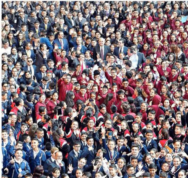
TODOS SALUDEN. Al final de la ceremonia, López Obrador y Esteban Moctezuma se tomaron fotos con los ganadores de la Olimpiada del Conocimiento Infantil.

La algarabía hacia del patio principal de Palacio un patio de recreo. Los ganadores de la Olimpiada y con los mejores promedios finales de