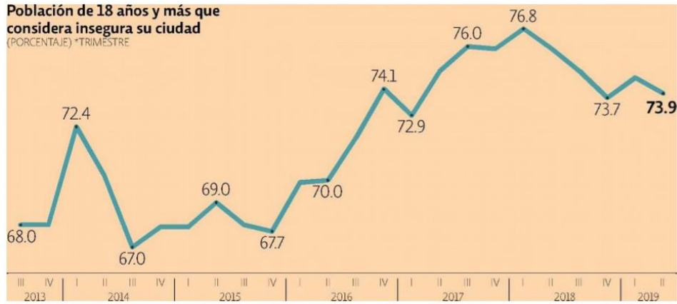
Población de 18 años y más que considera insegura su ciudad (PORCENTAJE) *TRIMESTRE