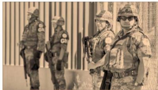
La inseguridad está peor que el año pasado, consideró el Observatorio Nacional Ciudadano.