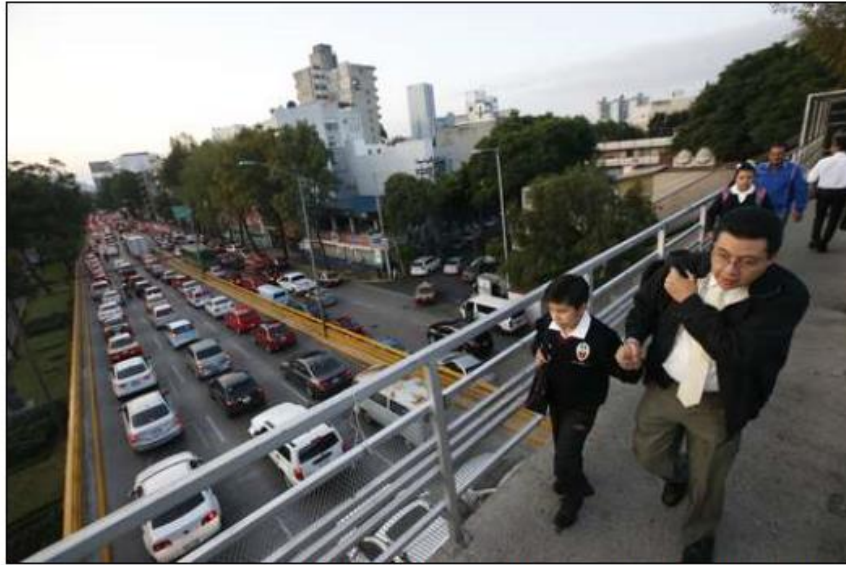
▲ Los padres pueden recuperar, mediante la deducción de impuestos, parte de los gastos que realizan por colegiaturas en escuelas particulares.