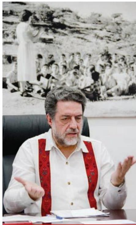
Luciano Concheiro, titular de Educación Superior, habla a Crónica.

Aunque el programa contempla 100 universidades para 2019, hasta ahora sólo se encuentran en funcionamiento 87, ubicadas—la mayoría—en zonas de alta y muy alta marginación, en terrenos regalados por ejidatarios o campesinos;