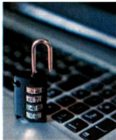
Las escuelas deben proteger sus sistemas.

Más información sobre el programa está disponible en www.optimiti.com.mx , también se puede escribir al correo electrónico escuela.cibersegura@optimiti.com.mx . ●