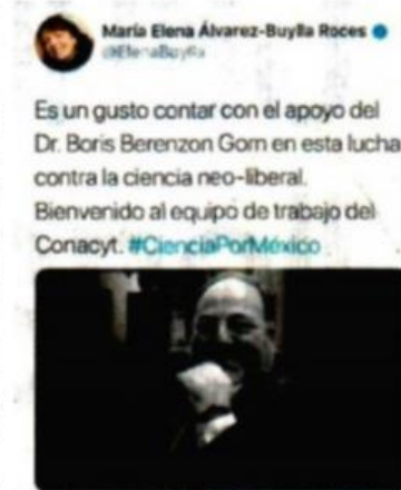
El sábado por la tarde la funcionaria subió este tuit.