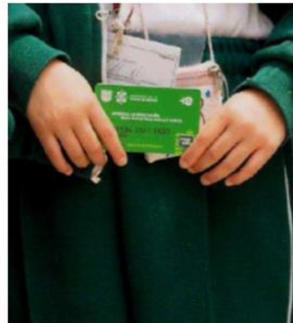
Será depositada los primeros 10 días de cada mes

"El Gobierno de la Ciudad de México brinda esta ayuda de manera universal pues para ellos todos los niños tienen talento no sólo los que tienen promedio de 10. El programa busca motivar a la niñez a convertirse en lo que deseen ser", explicaron a través de un comunicado.