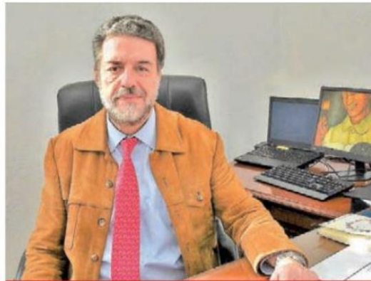
“De cada 12 mujeres que intentan entrar a la UNAM, sólo entra una”, resalta Luciano Concheiro, subsecretario de Educación Superior de la SEP.