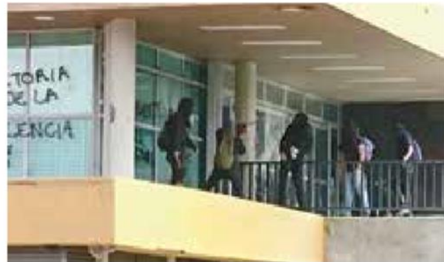
Condenan vandalismo en instalaciones de la UNAM

Se ha fortalecido, igualmente, la colaboración con autoridades de gobierno Federal, de Ciudad de México, Estado de México, Tlaxcala y Morelos, a nivel estatal y municipal, con quienes se sostuvieron más de 200 reuniones de coordinación, a fin de impulsar mejores espacios y condiciones de seguridad.