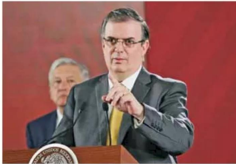
Sólo tres secretarios lograron una aprobación igual o superior al 50% de los encuestados.

evaluación del sexenio pasado fue la percepción de José Antonio Meade en 2017, el secretario más conocido y mejor evaluado del gabinete de Enrique Peña Nieto, que se ubicó en 17 puntos.