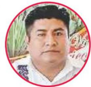
EL DE SAN PEDRO AMUZGOS, DEL PRD