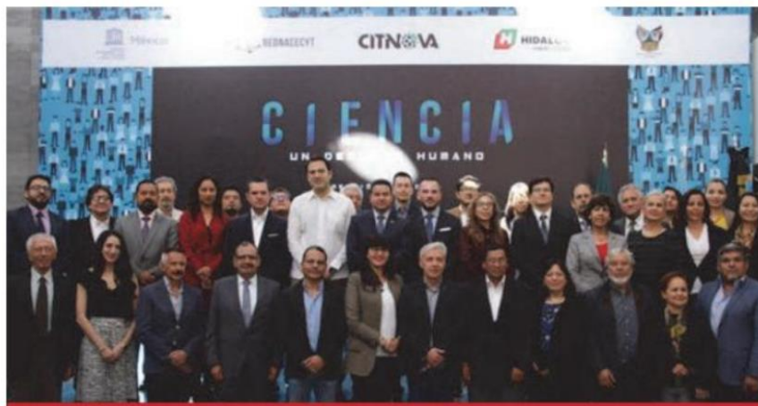
Miembros de la red, de 32 entidades, se reúnen estos días con representantes de la UNESCO.

“Uno de los objetivos de la Red es avanzar en el proceso de descentralización de la ciencia y la tecnología,