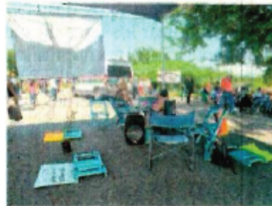
ROSELIA CHACA. EL UNIVERSAL