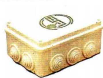
- Novedoso. El dispositivo fue diseñado para actuar en espacios públicos.

CONCIENCIA. APLICADO A EDIFICIOS PÚBLICOS, EL SISTEMA PODRÍA GENERAR UN AHORRO DE HASTA 25 POR CIENTO.