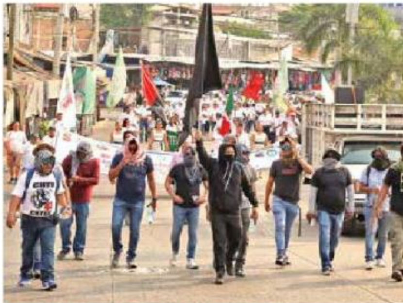
EXIGEN 40 BASES PARA MAESTROS