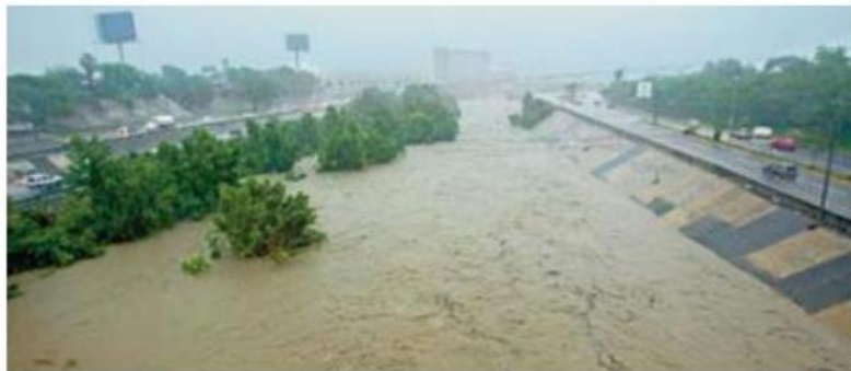
EFFECTOS. En la ciudad de Monterrey, Nuevo León, el paso de Fernand provocó la crecida del río Santa Catalina. Autoridades de Protección Civil reportaron que una persona fue arrastrada y salvada con vida.

Autoridades estatales informaron que hubo afectaciones a la circulación en la carretera Ciudad Victoria-San Fernando, debido a