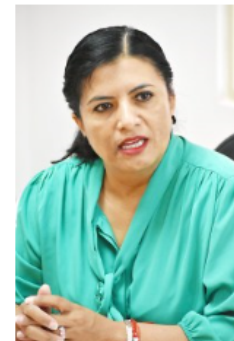
Arranca el CJEM carreras en línea impulsadas por el UPN.

Comentó que el Gobierno del Estado tuvo a bien firmar este convenio de colaboración con el UPN para apoyar a todas esas mujeres que quieren salir adelante, estudiar y trabajar para mantener a sus hijos o por darles un mejor nivel de vida, oportunidad que hoy ven cristalizada por el inicio de este ciclo escolar que tendrá una duración de 4 años.