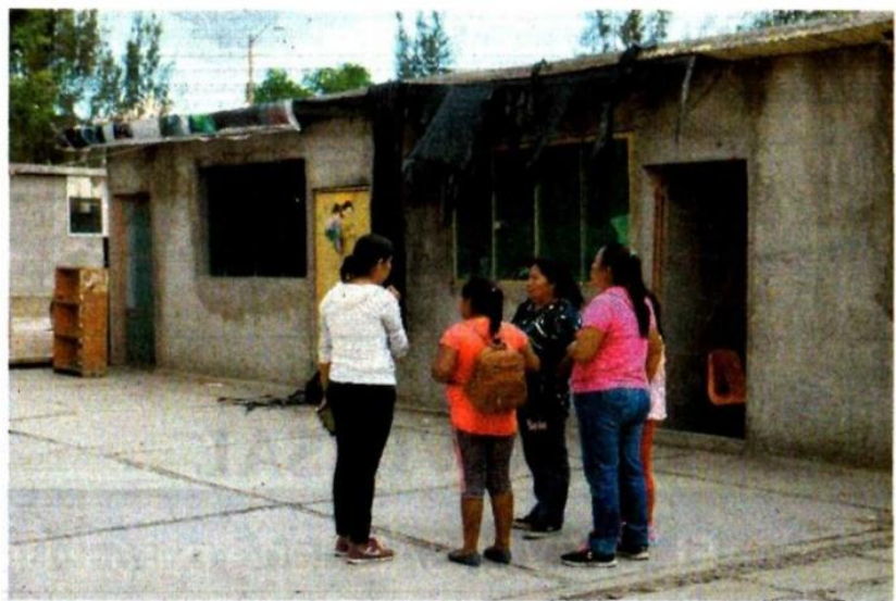
EDWIN HERNÁNDEZ. EL UNIVERSAL

Acusa que las obras en los planteles están detenidas por el abandono de las constructoras ante la falta de pago, cuya deuda fue heredada del anterior gobierno federal.