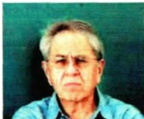
Jorge Alcocer Titular de la Ssa

El gobierno federal propuso un presupuesto de 128 mil 589.3 millones de pesos para la Secretaría de Salud, que representa un incremento de 8.1% en comparación con lo aprobado para 2019; 72 mil 538.3 millones, equivalentes a 56.4%, serán para subsidiar lo que antes era el Seguro Popular.