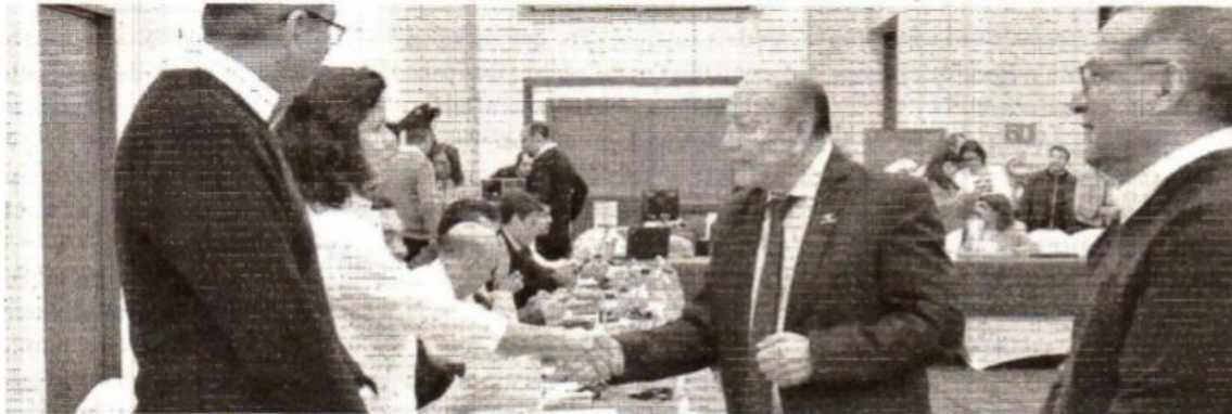
Tercer Intercambio de Mejores Prácticas: Tecnologías en el Aula.