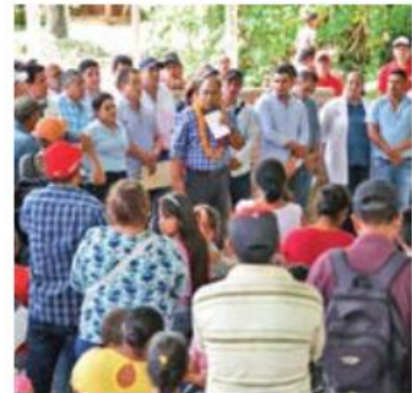
GUERRERO. El gobernador Héctor Astudillo, acompañado de su esposa, visitó a los habitantes del ejido Pie de la Cuesta, municipio de Atoyac a quienes les dio apoyos alimentarios.

La Unidad Estatal de Protección Civil y Bomberos de Jalisco informó que ayer se reanu-