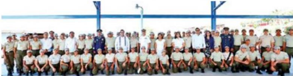
OPCIÓN. El gobernador de Baja California Sur, Carlos Mendoza, durante la apertura de la nueva escuela militar en la entidad; ésta, dijo, será un referente a nivel nacional; se busca que los jóvenes sigan sus estudios en las Fuerzas Armadas.

Esto es ya motivo de regocijo, dijo, pero si ponen su empeño, talento, espíritu de servicio y toda su dedicación serán recordados no sólo por ser los primeros, sino por ser los mejores. /CORRESPONSALÍA