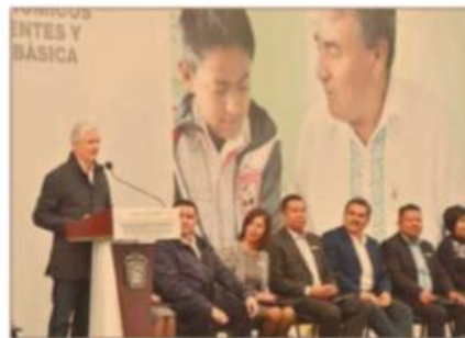
El gobernador del Estado de México entregó estímulos económicos a 3,672 docentes y directivos de planteles de educación básica .

Al entregar estímulos económicos y reconocimientos a 3,672 docentes y directivos de