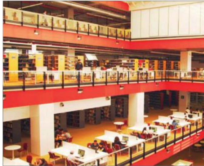
En las imágenes de la página anterior y ésta (abajo), se pueden ver maquetaciones computarizadas; sobre éstas líneas, los espacios de bibliotecas.

“El tema al final del día no es de dónde sale el recurso, por mucho recurso que pudiera parecer, para construir los edificios, sino cómo le garantizas estabilidad para su operación, para que el día de mañana no re-