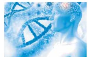
El galardonado considera al cerebro “el órgano más hermoso”.

Su increíble y apasionante testimonio de vida y profesional permiten ver la calidad humana que posee este incansable investigador, quien busca una cura contra el cáncer cerebral, una de las enfermedades más devastadoras que afectan, de acuerdo con él, “al órgano más hermoso de nuestro cuerpo”.