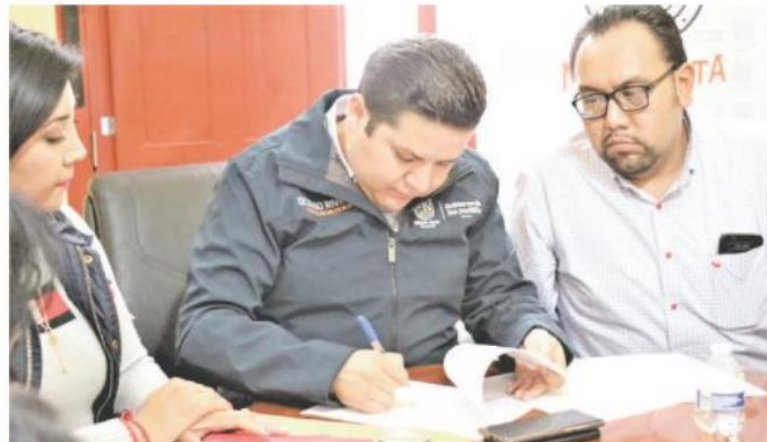
El edil firmó un convenio para entregar recursos a las guarderías en Milpa Alta.

Apuntó que aún hay mucho trabajo por hacer y “hoy más que nunca por las nuevas generaciones en un país en el que cada día se descompone más la sociedad, el que cada día la violencia y la inseguridad se hacen más fuertes y nos quieren ganar el paso”, e insistió