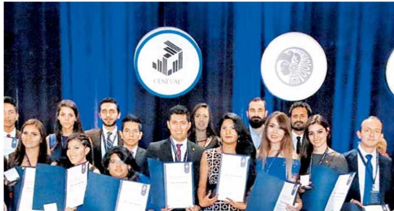
- Desarrollo. El centro realiza un trabajo profesional que contribuye al cumplimiento de los objetivos de las recientes modificaciones al artículo 3º.

Dos de las grandes definiciones del cambio de régimen en México tocan el trabajo medular del Ceneval: la prioridad en la atención a las personas en situación de pobreza y el énfasis en las regiones menos desarrolladas del país para combatir las desigualdades. A lo largo de la historia casi siempre resultaba válido el principio de que la cuna es destino; en un sistema económico como el que prevalece en la mayor parte del mundo actualmente, es muy difícil que una niña o un niño nacido en los hogares más pobres logre mejorar su situación económica. Pero, afortunadamente, la situación empieza a cambiar.