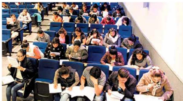
- Oportunidades. En esta nueva etapa el organismo hará énfasis en las regiones menos desarrolladas del país para combatir las desigualdades.

Si pudiera resumir en una frase estos 25 años, puede afirmarse que el Ceneval, hasta ahora, ha representado más de 40 millones de oportunidades académicas y millones de historias de éxito. ☺