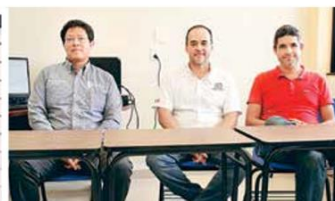
- Comunidad. Docentes y alumnos ponen en alto el nombre del tecnológico.