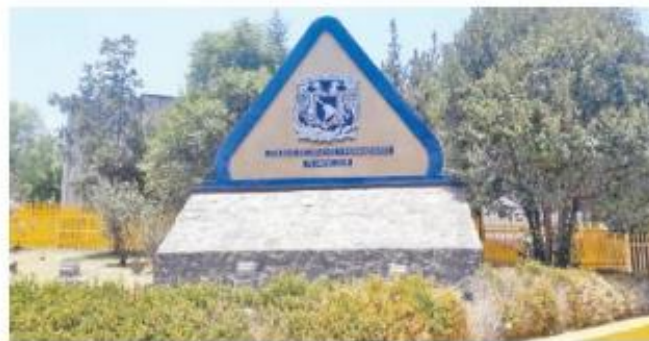
Fachada del Colegio de Ciencias y Humanidades donde se cometió el ataque.

LA ESTUDIANTE DE primer semestre asegura que cuatro de sus compañeros le ofrecieron comer un brownie, al parecer tenía marihuana, lo que le provocó un desmayo