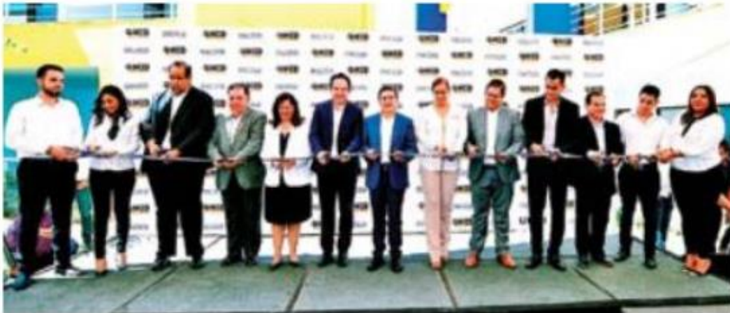
CAMPUS. El gobernador de Durango, José Rosas Aispuro, durante la inauguración de la Universidad Interamericana para el Desarrollo, en la región de la Laguna, tendrá capacidad para 1,500 alumnos.