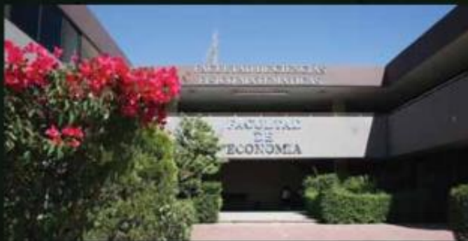
En la UAdeC se implementaron protocolos de actuación enfocados a las denuncias de violencia de género.

El caso de Lucía no es una excepción. Al menos 36 alumnas de la UAdeC denunciaron este año haber sido víctimas de acoso sexual por compañeros o profesores, pero las sanciones por