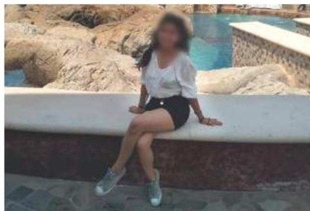
Familiares de la joven compartieron fotografías y señas para dar con su paradero.

Caen por robo y plagio Dos sujetos que robaron una camioneta con dos menores a bordo.