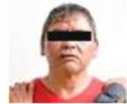
Los sujetos fueron puestos a disposición de la Fiscalía Especial contra el secuestro.

la Madrid Hurtado, alcaldía Iztapalapa, y en su intento de fuga tomaron rumbo a la carretera México-Puebla con los hijos del propietario del vehículo a bordo.