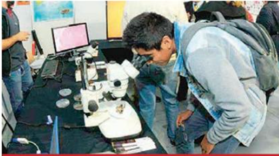
La sede principal será en Universum.