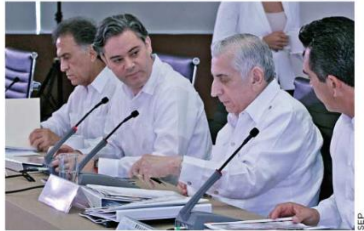
■ El titular de la SEP, Aurelio Nuño, encabezó la reunión de coordinación regional Sur-Sureste, en Tabasco.

“Hemos pasado de un proceso importante de implementación de la reforma educativa al Modelo Educativo que plantea por primera de manera estructurada y clara, las políticas públicas que permitirán la transformación del sistema educativo”.