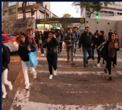
Durante el ciclo escolar 2018-2019 el 51.1 por ciento de los estudiantes en la UNAM correspondieron al género femenino.

Los tres candidatos que se encuentran disputando la titularidad de la UNAM están promoviendo un plan de trabajo donde se dé prioridad a las mujeres dentro de la Máxima casa de Estudios