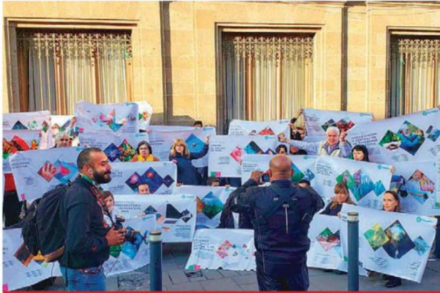
Científicos de diversas instituciones se han manifestado en Palacio Nacional, en desacuerdo a las políticas científicas de la 4T.