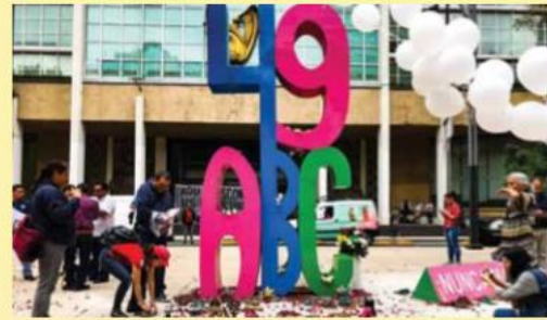
Familiares de los menores fallecidos acusan que llevan 10 años buscando justicia sin éxito.