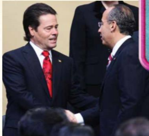
Eduardo Bours, quien fuera el gobernador de Sonora durante el incendio de la Guardería ABC se deslindeó por completo de los hechos.

“De conformidad con lo previsto en el artículo 4, párrafo cuatro de la Ley General de Víctimas, la acreditación del daño