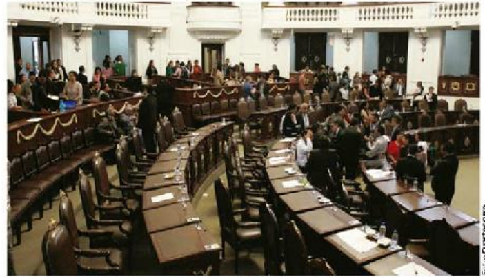
DIPUTADOS LOCALES al suspender actividades en la ALDF, ayer.

De esta manera, la presentación del punto de acuerdo a cargo de la diputada priista en calidad de presidenta de la Comisión de Educación será hasta el 18 de