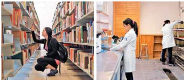
-Participación. Cada integrante de la comunidad universitaria refuerza la autonomía.