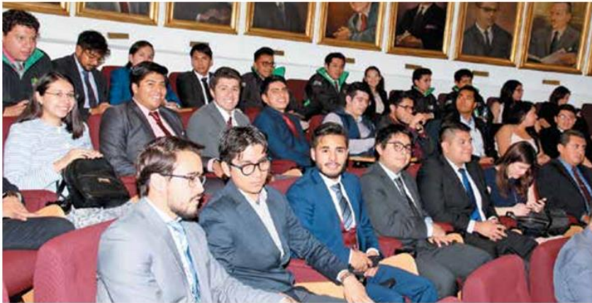
- Aprendizaje. 41 estudiantes politécnicos participaron con miras a estudiar posgrados en Europa.