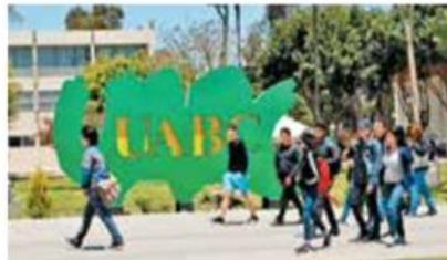
- Los equipos revisarán quejas de abusos.

Las funciones de los comités serán: proponer programas de sensibilización y prevención en materia de violencia de género dirigidos a la comunidad universitaria; trabajar de manera conjunta con las autoridades universitarias en la adecuación y mejora continua de los protocolos de atención y seguimiento a actos de violencia de género; recibir reportes y quejas de actos de violencia de género en los que presuntamente estén involucrados miembros de la comunidad universitaria.