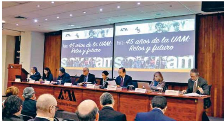
- Vínculo. El secretario general ejecutivo del organismo destacó la relación de la asociación con la UAM.