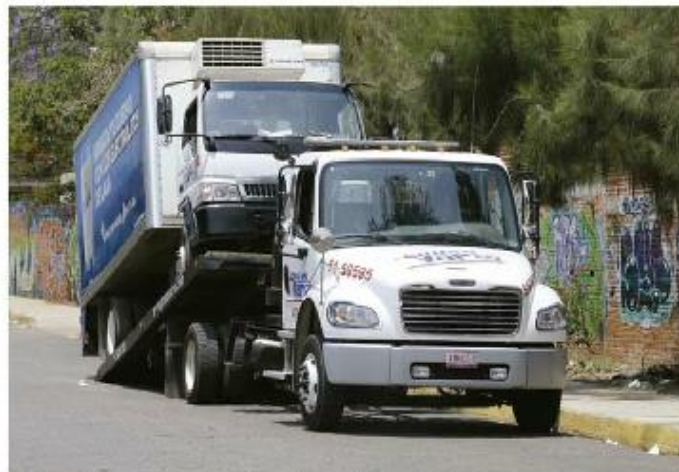
Grúas tuvieron que remolcar a las unidades despojadas de sus mercancías, ayer.

Además de los productos que transportaban las unidades, algunas fueron despojadas de sus computadoras, llantas y baterías.