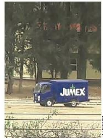
Camiones quedaron varados en escuelas.