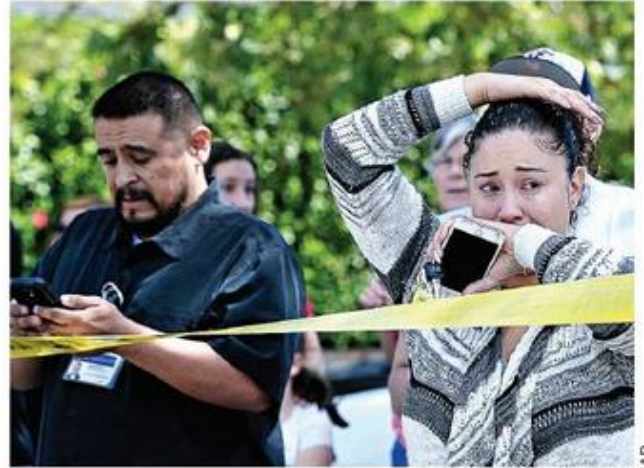
Padres tuvieron que esperar ayer para reunirse con los 500 niños evacuados de la escuela.

La violencia es una herida abierta en San Bernardino, una ciudad que trata de recuperarse de una quiebra financiera prolongada y el ataque terrorista de 2015, que dejó 14 muertos.