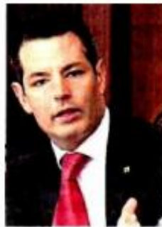
Alejandro Murat Hinojosa

A cuatro meses de asumir la gubernatura de Oaxaca, el priista Alejandro Murat se muestra firme ante las acciones de presión ejercidas por la Sección 22 de la CNTE, pues, nos cuentan, el magisterio exige que se regularicen más de 3 mil plazas y que los egresados de escuelas normales no presenten examen de evaluación. Ayer, en un intento de seguir con el boicot a actos oficiales de don Alejandro, el líder local de la CNTE llamó a una movilización, pero resultó que los maestros ahora sí se fueron de vacaciones y nadie lo respaldó, tanto así que el mandatario y el director general del IMSS, Mikel Arriola , estuvieron por más