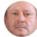
José Rafael Ojeda

Álgido debate se pronostica en el Congreso por la iniciativa que se impulsa desde Palacio Nacional, para dar más facultades a la Secretaría de Marina, que encabeza el almirante José Rafael Ojeda . Dicha propuesta prevé entregar a la dependencia el control de todos los puertos del país, con el objetivo de que se combata la corrupción.