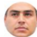
Omar García H.