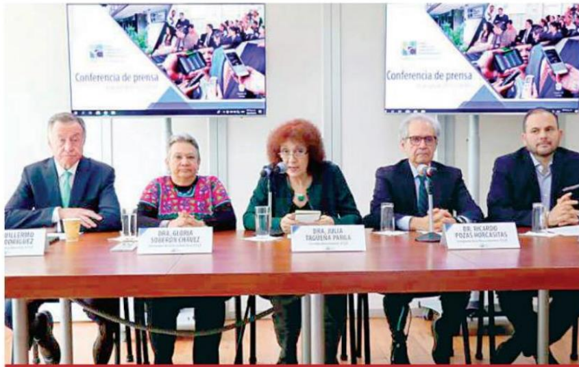
Independientemente de la resolución, el Foro deberá convertirse, conforme lo que la comunidad exprese en la nueva Ley General de Ciencia y Tecnología.

institución, en la sentencia el Juez ordena al Conacyt entregar los recursos económicos suficientes para garantizar que el Foro Consultivo Científico y Tecnológico esté en posibilidad de llevar a cabo su Programa de Actividades, así como para cumplir las funciones que prevé la Ley de Ciencia y Tecnología. “Reconoce también que esa obligación debe cumplirse de manera permanente”.