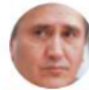
Luis Raúl González

Nos cuentan que el ex titular de la CNDH, Luis Raúl González Pérez , regresó por la puerta grande a su alma máter. El rector de la UNAM, Enrique Graue , lo designó coordinador del Programa Universitario de Derechos Humanos, lo cual fue muy aplaudido entre la comunidad de la máxima casa de estudios.