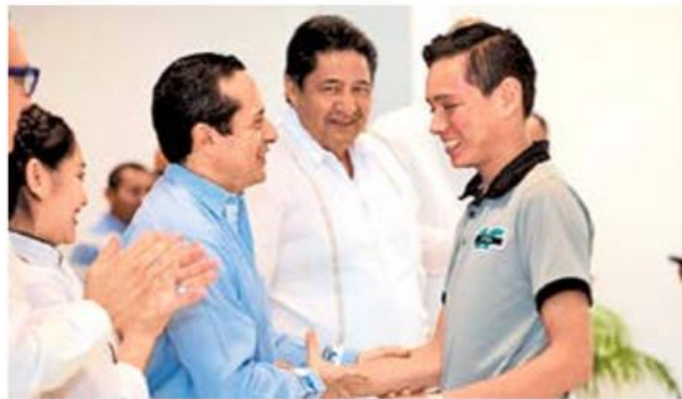
COMPROMISO. El gobernador de Quintana Roo, Carlos Joaquín, anunció que se mantendrá la inversión en infraestructura educativa, en beneficio de los jóvenes.

De acuerdo con Abraham Rodríguez Herrera, director general del IFEQROO, con el recurso de 350 millones de pesos se edificarán, además de los 13 nuevos planteles edu-