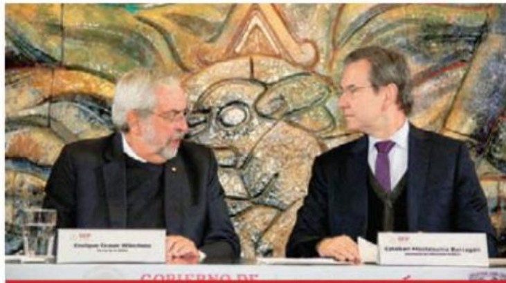
Enrique Graue Wiechers y Esteban Moctezuma Barragán.

El universitario dijo que México necesita de una infraestructura educativa acorde a principios contemporáneos, de uso de energías limpias y renovables, de apro-