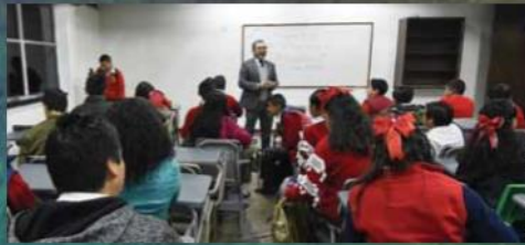
Los maestros, tanto de escuelas públicas como privadas, se enfrentan cada vez con mayor frecuencia a alumnos violentos tanto física como verbalmente.

No hay una ley que nos ampare ni que regule la disciplina de los niños, solo existe un manual llamado "Marco para la Convivencia", donde las sanciones son mínimas"