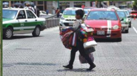
El entorno de violencia y la falta de convivencia con sus familiares son elementos que afectan el desarrollo de los menores de edad en el país.

generan aislamiento y son un foco de riesgo para consumir contenidos violentos o no aptos para su edad.