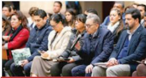
Como parte El rector de la UAEM, durante la charla con universitarias.

En el encuentro destacó la demanda de las universitarias para fortalecer los protocolos de prevención sobre casos de acoso y hostigamiento sexual al interior de la máxima casa de estudios mexiquense, por lo que se anunció una nueva reunión para el 26 de febrero.