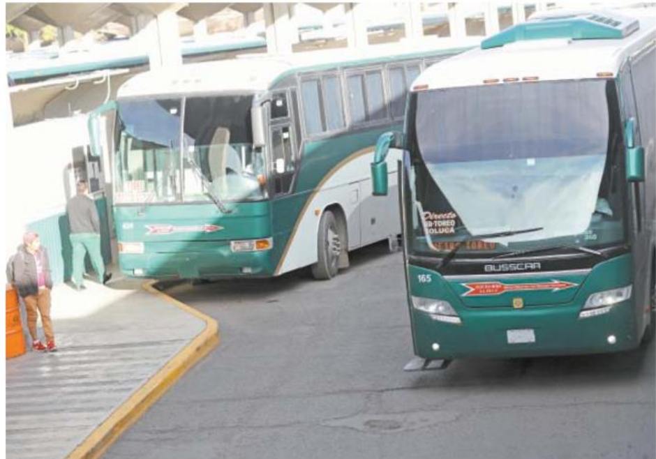
JORGE ALVARADO. EL UNIVERSAL

Los representantes sindicales de los operadores reiteran que no van a retirar las denuncias por secuestro y robo contra los estudiantes establecidas ante la Fiscalía General de la República (FGR), puesto