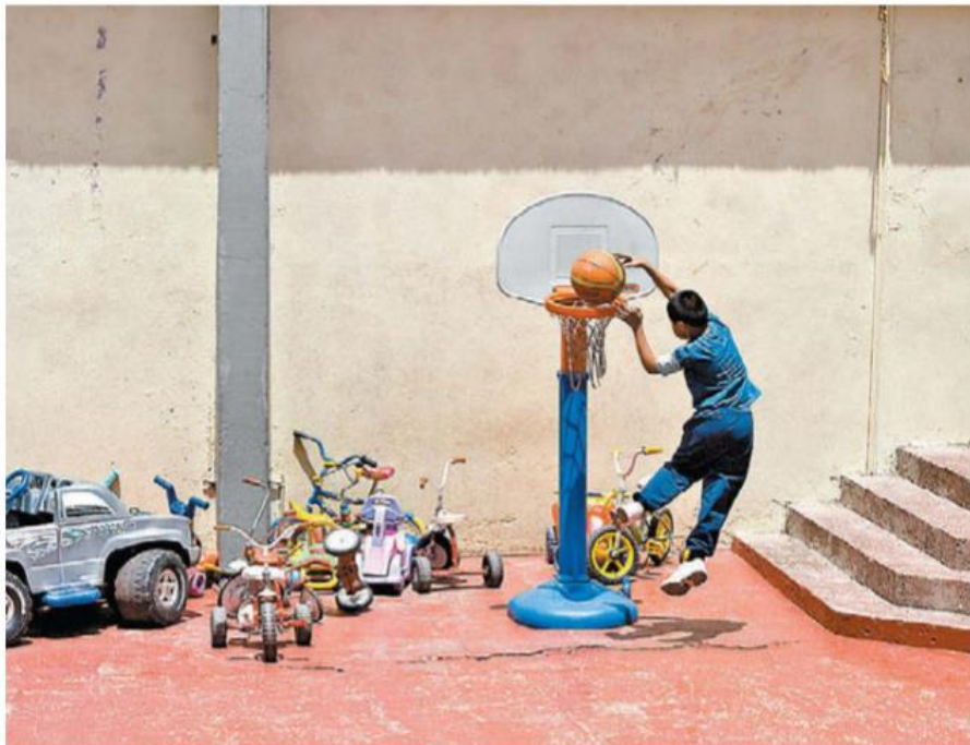
Con la operación de 2018 por cada niño inscrito recibían 950 pesos.

Los amparos se concedieron a unas cuantas madres y estancias de Chihuahua y de la Ciudad