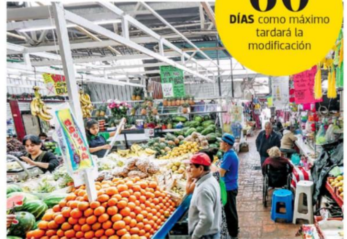
Las autoridades se han dado la tarea de mejorar las instalaciones eléctricas de los mercados

Después de un análisis con el área de energía de la Secretaría de Desarrollo Económico (Sedeco), la Comisión Federal