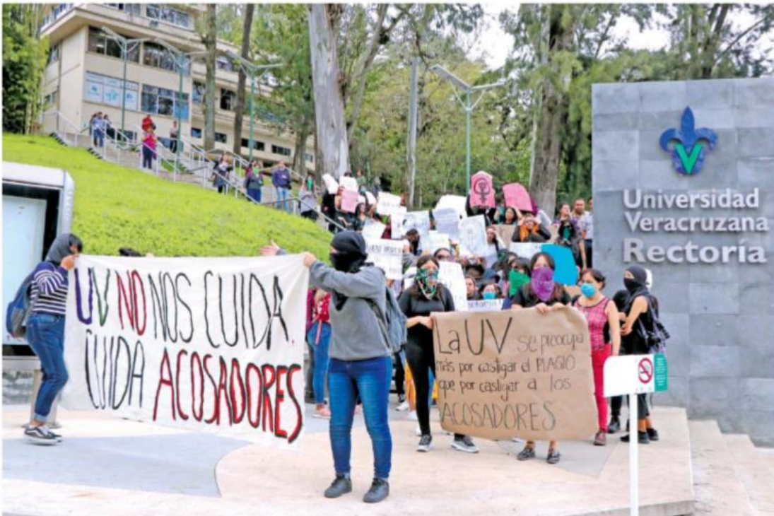
De 2015 a 2019, la Universidad Veracruzana recibió 42 denuncias por hostigamiento y acoso sexual