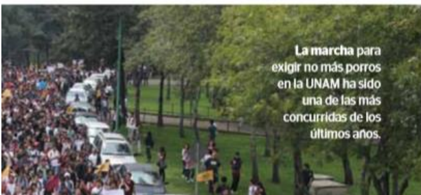
La marcha para exigir no más porros en la UNAM ha sido una de las más concurridas de los últimos años.

“Las diferentes formas de violencia hacia las mujeres están presentes en la Universidad pero sí tiene solución. Me parece que la UNAM podría apoyarse de los académicos y atender de mejor manera este problema y no solo con una línea institucional como denunciar, investigar y sancionar a los culpables, primero hay que reconocer las demandas legítimas de los alumnos y priorizar el origen de las denuncias”, señala.