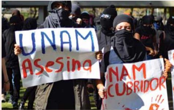
Alumnas de la UNAM acusan que a pesar de sus denuncias por acoso sexual, muchos de los agresores no han sido expulsados.

Comentarios misóginos, propuestas indecorosas y fotografías sin su consentimiento es lo que vivieron algunas alumnas de Cuautitlán; por ello, el 24 de