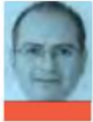
ERNESTO VILLANUEVA INVESTIGADOR DEL INSTITUTO DE INVESTIGACIONES JURÍDICAS DE LA UNAM @EVILLANUEVAMX