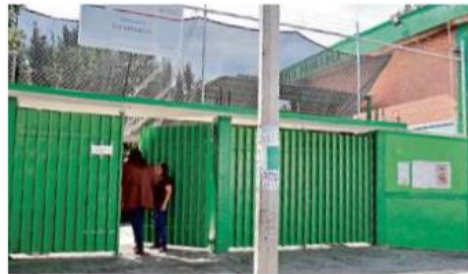
En los planteles más afectados se han suspendido clases.

“Se cancelan las clases porque las pipas que manda la Alcaldía no alcanzan o no llegan a tiempo. Los directores no se dan cuenta de que sus cisternas ya bajaron mucho el nivel, entonces para el siguiente día ya no les alcanza. En lo que hacemos el reporte, ellos ya vienen llegan-