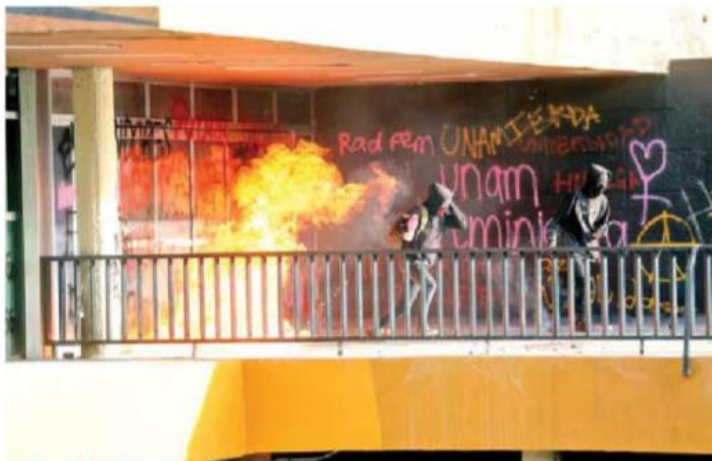
VIOLENCIA EN PLANTELES

También tres facultades de la UNAM a las que asisten un total de 18 mil 316 jóvenes, están sin actividades.