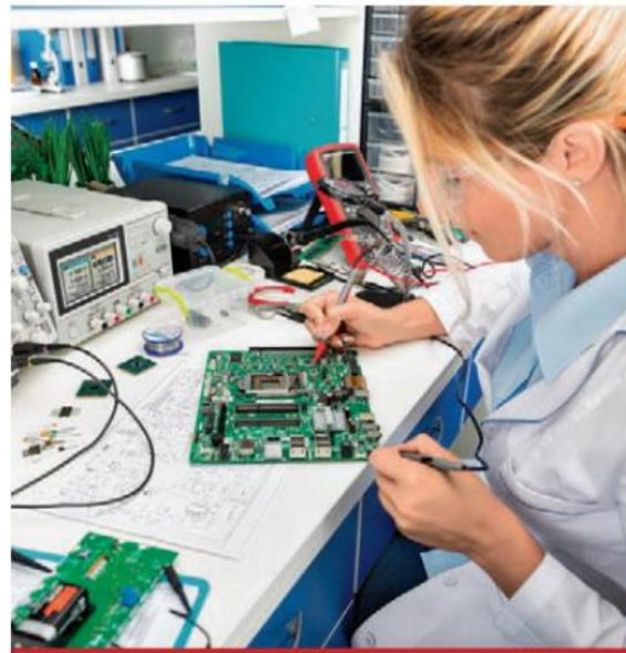
La brecha salarial es descomunal, revela estudio del Conalep a través de la SEP.

El diagnóstico del Conalep va más en sintonía con otras visiones, como la de la Secretaría de Hacienda, para la cual la desigualdad salarial “es el tema más urgente en el ámbito del desarrollo social en México, así como la baja participación de las mujeres en el mer-