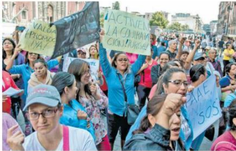
Integrantes de la Coordinadora protestaron afuera de Palacio Nacional en julio del año pasado.

En la página 25 del PTEO, se plantea que este programa busca un "enfoque comunitario crítico, que tiene como eje central la recuperación y articulación de los saberes comunitarios, para construir los currículos escolares que den sentido y significado al proceso for-