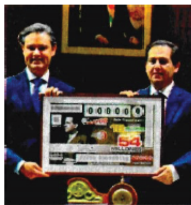
JOEL MERINO, EL UNIVERSAL