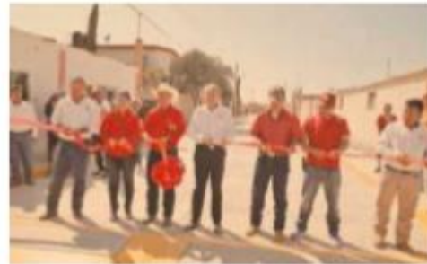
Durante una gira de trabajo por localidades del municipio de Villa de Arista, el gobernador de SLP dijo que lo realizado mejora la calidad educativa.