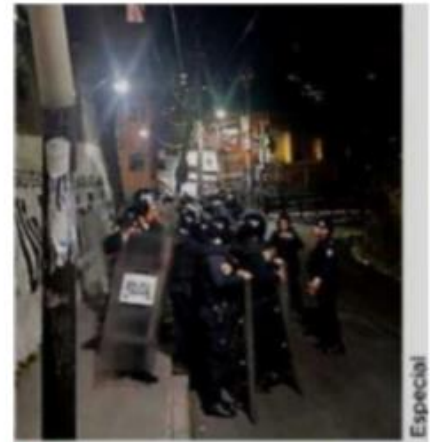
■ Padres reclamaron en una escuela de Á. Obregón.

“En el sitio, los oficiales se entrevistaron con una mujer de 43 años, quien les refirió que su hijo, de 13 años de edad, había sido abusado sexualmente por el conserje