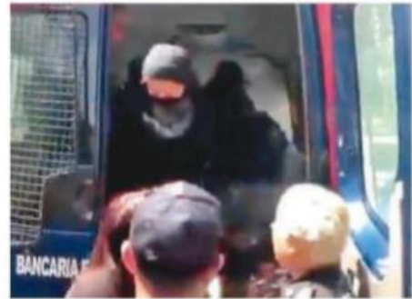
La Secretaría detalló que fueron detenidas 16 mujeres y dos hombres. Especial