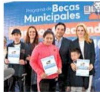
ARRANQUE. El alcalde de Huixquilucan, Enrique Vargas, otorgó mil 739 apoyos.