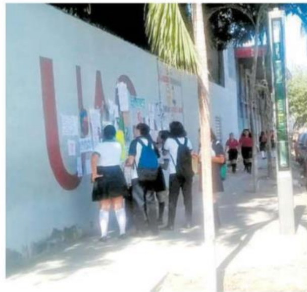
Las alumnas colocaron un muro de protestas

Las alumnas fueron respaldadas por estudiantes (hombres), durante la colocación del muro de protesta en el plantel educativo contra la violencia de género.