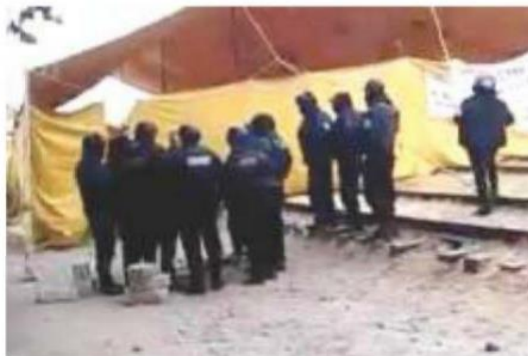
UNIFORMADOS en la zona liberada ayer, en Lara Grajales.