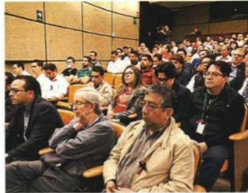
- Impacto. La dependencia busca difundir la igualdad y la inclusión entre alumnos de ambos sexos.

La SEP, agregó, tiene una gran responsabilidad al incluir en los planes y programas de estudio todo el tema de la igualdad, el respeto y la inclusión, además de atender los factores exógenos a la educación, como la nutrición y los avances científicos en distintas materias.