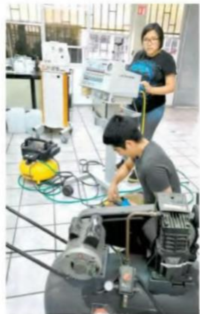
EL ITM se reunirá con el IMSS para ver cómo ayudarán de manera gratuita

RESPIRADORES son los que se están analizando, de los cuales uno ya está funcionando