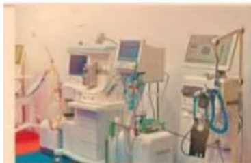
Ventiladores. Tendrán nuevo modelo en 10 días, aseguran.