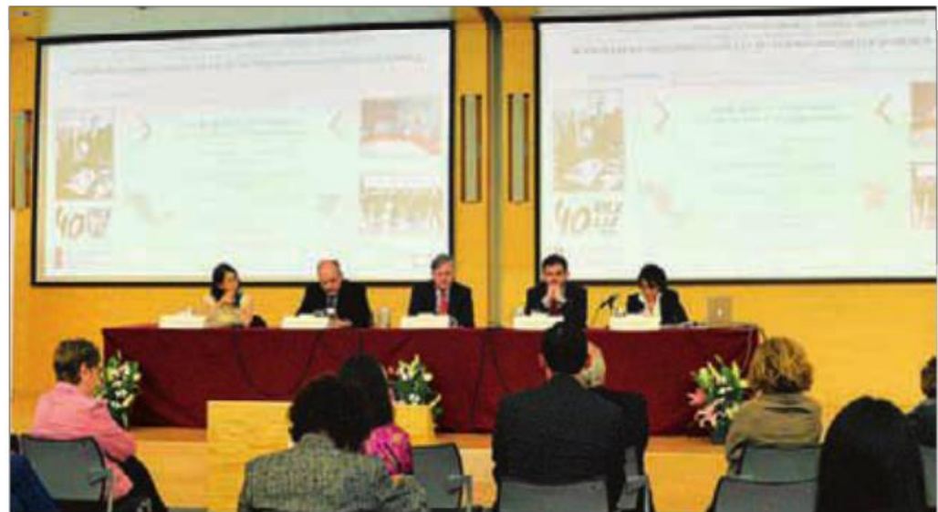
El programa de actividades fue presentado ayer en El Colegio de México.