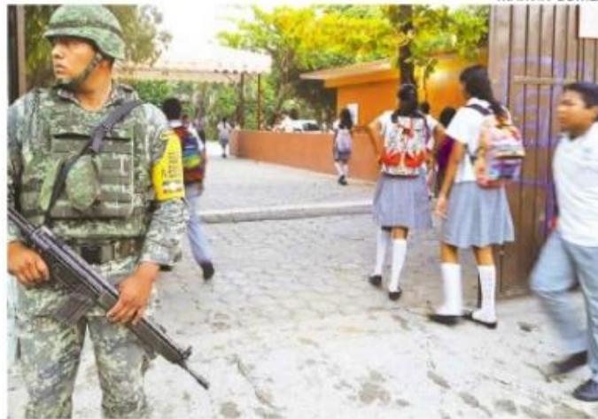
LA PRESENCIA de los militares inhibe los delitos, señalaron padres de familia.

Cabe mencionar, que además de la vigilancia en los planteles, otros elementos realizaron recorridos por las colonias, en camio-