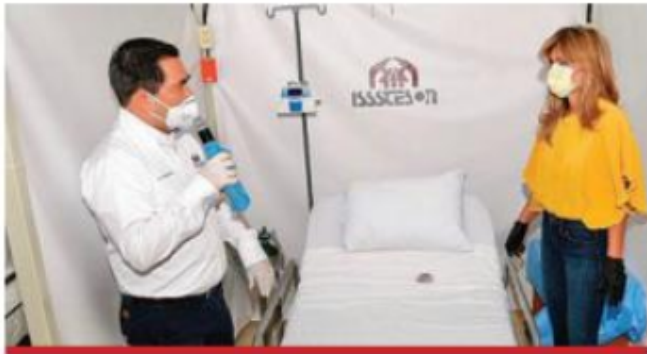
Pavlovich en reconversión de inmuebles del SNTE a hospital COVID.

“Aquí hay hasta 101 camas para poder atender a las personas que resulten contagiadas por COVID-19, con todos los protocolos, refrigerados, completamente aislados y es por un gran esfuerzo, muchas gracias a la gente de la Sección 54 del SNTE por apoyarnos y brindarnos estas instalaciones” señaló la gobernadora.