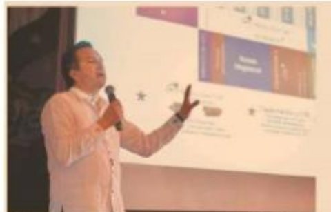
Educación básica reanudaría clases el 10 de agosto; media superior y superior hasta el 21 de septiembre, informa el gobernador C. García.

Del 3 al 7 de agosto, y en coordinación con los consejos de Participación Es-