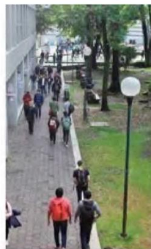
ALA ESPERA. Varias universidades, no han definido el retorno a las clases presenciales tras cuarentena.

El ITAM no ha emitido información alguna sobre su retorno a la Nueva normalidad, y en la misma situación están la Universidad Panamericana (UP) y la Universidad del Valle de México (UVM).