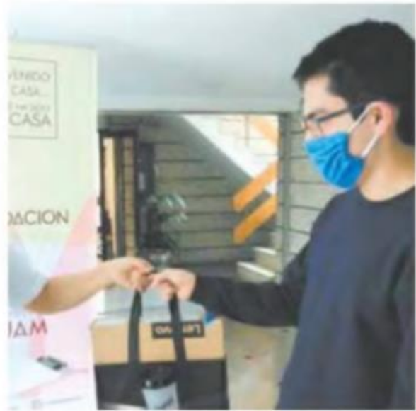
● La universidad entregó 34 equipos de cómputo a alumnos que han sido afectados por la pandemia.

Constituida formalmente a finales de 2019 con personalidad jurídica propia y conformada por egresados y amigos de la Institución, la Fundación coadyuva al reforzamiento de la identidad universitaria y la obtención de fondos propios.