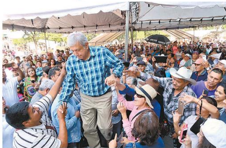
López Obrador sigue los pasos del dictador cubano en su programa de gobierno 2018.

4. En el lineamiento 43 dice que “llevará a cabo una auténtica revolución educativa orientada a mejorar la calidad de la enseñanza y a garantizar que nadie, por falta de espacios, maestros o de recursos