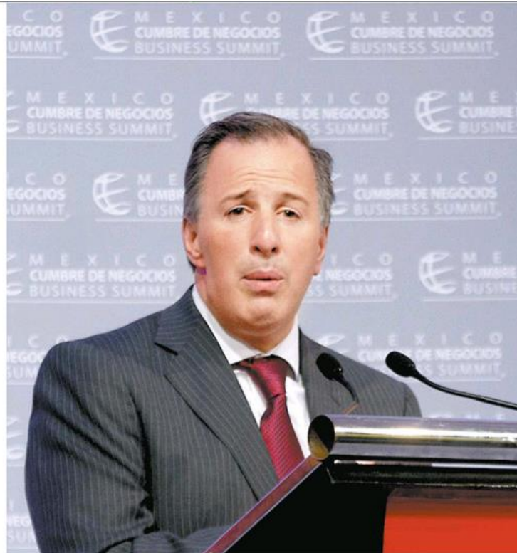
José Antonio Meade, secretario de Hacienda, ha dicho algo así como ¡fuera máscaras!

asuntos de la economía, titula sus Co-ordenadas con esta frase de dar miedo: “Prepararse para una tormenta perfecta”, la mano viene pesada. No somos nada. Gamés no lo sabía, pero si ha fracasado el acuerdo la OPEP para bajar su producción y se rechaza la reforma constitucional en Italia propuesta por el primer ministro Renzi, todo se descompondrá en Europa. ¿Como la ven? Dicho sea esto sin la menor intención de un albur en crisis.