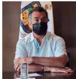
El gobernador Jalme Rodríguez tendrá una estrategia propia para el regreso a clases.

Calderón a través de sus redes sociales, después del anuncio de la SEP referente al regreso a clases, las autoridades estatales evaluarán la situación particular de Nuevo León para adaptar la vuelta a las aulas según las necesidades y los indicadores estatales.