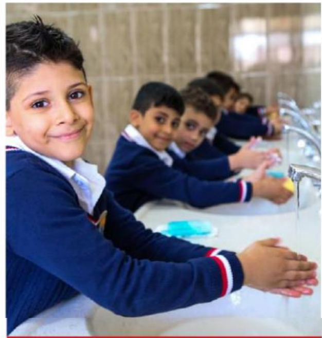
Impulsarán hábitos como la higiene y la actividad física.