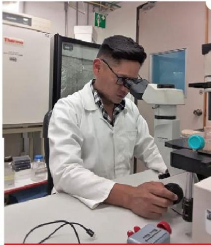
La investigación se realizó por alrededor de una década por investigadores de la ENCB.