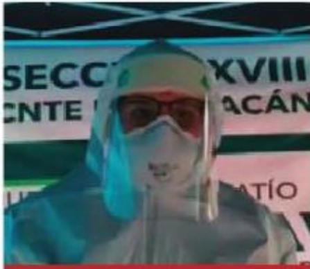
Personal médico de la Secretaría de Salud capitalina supervisa la salud de los manifestantes.

recibir atención médica, sobre todo las comunidades indígenas, quienes se encuentran en campamentos y sin servicios básicos, como el agua para sanitizar las tiendas de campaña.