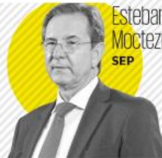
Esteban Moctezuma SEP