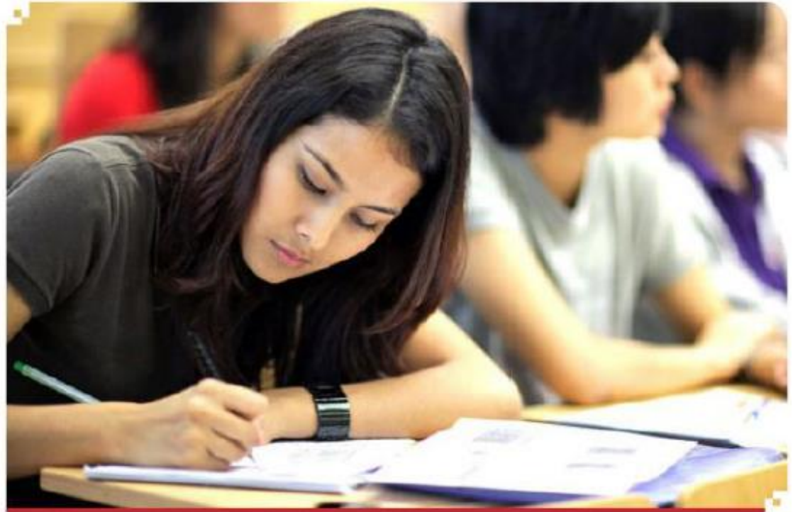
El estudio Panorama de la Educación 2020 analiza más de 100 indicadores sobre educación básica, media y superior en los 51 países miembros de la OCDE

“La expansión de la educación superior es una tendencia mundial. Entre el 2009 y 2019, la proporción de personas de 25 a 34 años de edad que tenían un título de educación superior aumentó en todos los países que pertenecen