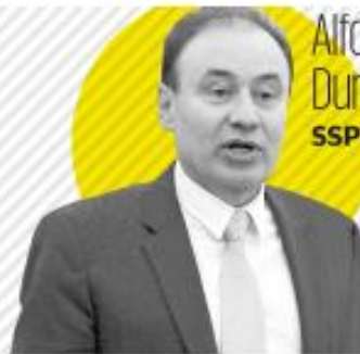
Alfonso Durazo SSP