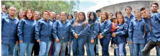
Jóvenes Construyendo el Futuro, a cargo de la STPS, es uno de los programas estrella del gobierno federal.