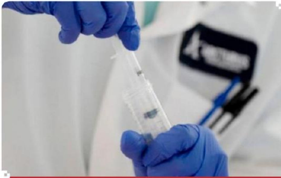
Conacyt y los Centros Públicos de Investigación recibirán 26 mil 573.1 millones de pesos.

para investigación científica y desarrollo tecnológico que se entregará a la Secretaría de Educación Pública (SEP) para ser repartido a diferentes universidades e institutos, esa dependencia se consolida como la mayor receptora de fondos públicos para ciencia con 42 mil 853 millones de pesos.