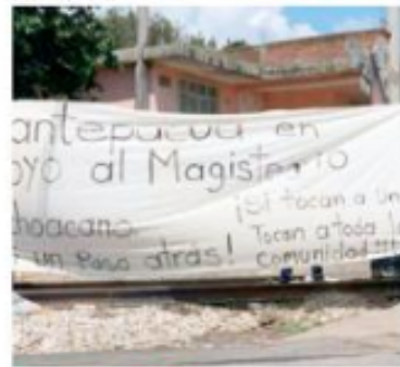
PUERTO CLAVE. Los vagones se encontraban varados en Lázaro Cárdenas.

En la zona se mantenía ayer el monitoreo, sin que hasta el cierre de esta edición se supiera si existía