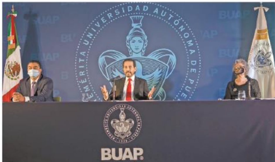
El rector Alfonso Esparza (centro) dijo que la polarización en el país es un riesgo para la democracia.

El rector rindió su tercer informe en un formato inédito, que inició con un video estructurado