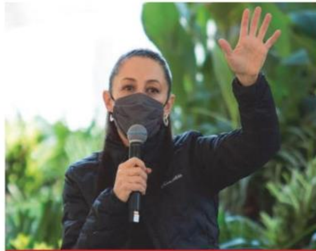
Claudia Sheinbaum, jefa de Gobierno de la Ciudad de México.

Para Sheinbaum Pardo, el rechazo entre los comuneros, que además integran las ligas de deportistas —a quienes en San Pedro Atocpan señalan de ser los ‘hostigadores’—es por falta de información en la población. Sin embargo, anunció que se realizará una campaña para difundir los alcances educativos en este pueblo milpaltense, el más rezagado y analfabe-