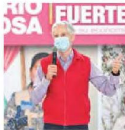
GOBIERNO DEL EDOMEX

Subrayó que es un programa de apoyo dirigido a la economía fami-