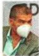
Miguel Riquelme Solís

:::: Y quien de plano explotó contra el gobierno federal, nos aseguran, fue el gobernador de Coahuila, Miguel Riquelme Solís (PRI), sobre todo luego del anuncio del Plan de Infraestructura del gobierno federal, en el que no se incluye ningún proyecto para su terruño. Según nos informan, sin pelos en la lengua, don Miguel advirtió que muchos municipios coahuilenses tendrán problemas hasta para pagar la nómina, y adelantándose a los alegatos del Centro, afirmó que aquello de "ajustarse el cinturón" no es posible, porque el mismo ya dio dos vueltas. "Hay bombas de tiempo a las que les llegó la hora de explotar", se escuchó por ahí.